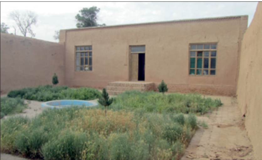
نمایی از خانه تاریخی استاد کمال الملک در روستای حسین‌آباد فیروزه