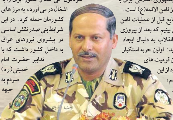
یادواره شهدای عملیات ثامن الائمه(ع)

او با بیان اینکه اگر به وقایع قبل از عملیات ثامن الائمه(ع) توجه شود می بینیم که بعد از پیروزی انقلاب، نیروهای ضدانقلاب به دنبال ایجاد اغتشاش بودند، می گوید: اولین حربه استخبار جهانی اختلاف افکنی بین قومیت های شیعه و سنی در کشور بود از این رو برای برقراری نظم، آرامش و امنیت اولین یگانی که برای مبارزه با گروهک های ضد