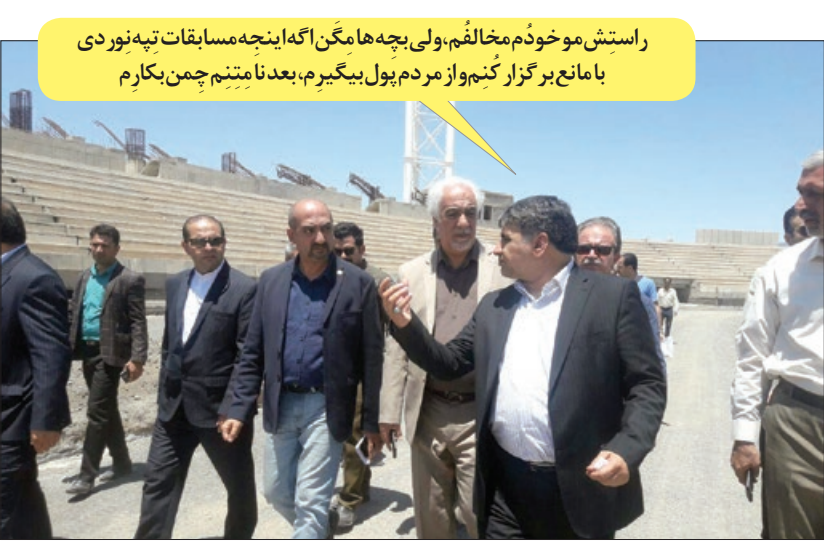
راستش موخو دُم مخالفم، ولی بچه ها مگن اگه اینچه مسابقات تپه نور دی بامانع بر گزار کنیم واز مردم پول بیگیرم، بعد نا میتیم چمن بکار م

تپه نوردی در ورزشگاه بی چمن این معاون، جایزه قوی ترین «چشم» سال را به ورزش دوستان سبزواری تقدیم می کنیم که در تمام این سال ها چشم شان به افتتاح این ورزشگاه دوخته شد اما خشک نشدو آب مروارید نگر فت! باشد که مسئولان راهی برای تامین اعتبار پیدا کنندو این ورزشگاه کلنگ زنی شد، بازدید کر دند. ضمن خداقوت به