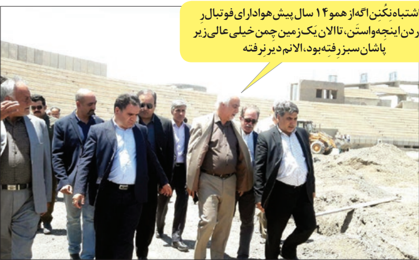
نه اشتباه نکنن اگه از همو ۱۴ سال پیش هواداری فوتبال ر میاوردن اینچه واستن، تالا کن یک زمین چمن خیلی عالی زیر پاشان سبز رفته بود، الانم دیر نرفته