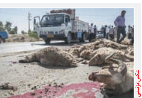
زلزله در خراسان