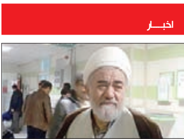
شعر پدر برای پسر