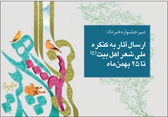
دبیر جشنواره خبر داد:

گالری آذرنور در نظر دارد حراجی از آثار نقاشی داشته باشد که این حراج از روز جمعه ۱۸ دی آغاز می‌شود. این دومین حراج آثار هنری این روزها در مشهد است. علاقه مندان برای بازدید و خرید می توانند روز جمعه هجدهم دی ماه ساعت ۱۷ به محل دائمی گالری آذرنور واقع در خیابان راهنمایی ۱۰ مراجعه کنند.