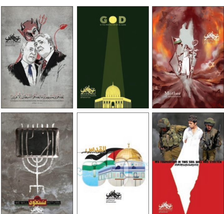
پوستر «فریاد مادر»

تقویمِ رمضان یک بار دیگر به آخرین جمعه خود می رسد. روزی که برای آزادی خواهان جهان، نماد دفاع از ملت ی مظلوم است که صدایش زیر پر آوار ظلمی بزرگ، ساکت شده است. روز «قدس» مجالی است برای گفتن از غربت و مظلومیت مردم فلسطین. البته که هر روح آزاده‌ای، زبان و شیوه بیان خاص خود را در این زمینه دارد اما یک ابزار، زبان شیوای هنر است. این سال ها نما یشگاه ها و برنامه های هنری زیادی با محوریت آثار هنری فلسطین بر گزار شده است و هنرمندان زیادی در این عرصه، مشتاقانه حضور یافته و دست به خلق آثاری ماندگار زده اند. ار دیپشت نیز اولین کارگاه بین المللی گرافیک و طراحی پوستر «عوده القرن» با حضور ۳۰ هنرمند از کشورهای مختلف جهان نظیر الجزایر، فلسطین، سوریه، لبنان، عراق، بحرین، افغانستان، پاکستان و هند و... و همچنین ۴۰ هنرمند ایرانی، در مشهد برگزار شد. ما حاصل این رویداد هنری، تولید ۹۰ پوستر بود که از میان آن ها ۴۰ پوستر برای توزیع بین المللی انتخاب شدند و همزمان با روز قدس، در نما یشگاه های مجازی پیش چشم مخاطبان کشورهای مختلف جهان قرار گرفته است. در این گزارش به این کارگاه و نما یشگاه و اهداف متولیان برگزاری و هنرمندان شرکت کننده در آن پرداختیم.