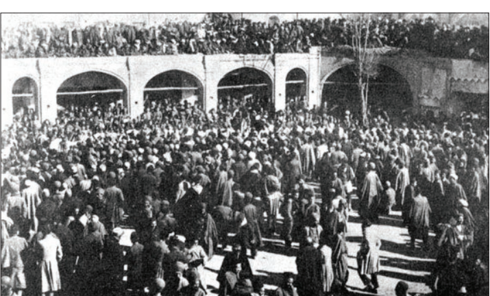
عکس تاریخی است

پنجاه‌هزار نفر برآورد کرده است. فیزیکی دیگر سیاح اروپایی جمعیت مشهد را چهل هزار نفر تخمین زده و مسیو کنولی که در سال ۱۸۲۳ م از مشهد دیدن کرده، جمعیت آن را ۴۵ هزار نفر نوشته است. بارنز از دیگر سیاحانی است که در سفرنامهٔ خود از جمعیت چهل هزار نفری مشهد یاد کرده است. ضمن آن که «مسیو فربه» فرانسوی در سال ۱۸۴۵ م و خانیکوف و شیندلر به‌طور مشترک جمعیت مشهد را شصت هزار نفر، لرد کرزن ۴۵ هزار نفر و هانری رنه آلمانی در سال ۱۸۹۹ م. جمعیت آن را هشتاد هزار نفر برآورد کرده‌اند. [۲] از این میان، جهانگرد دی دیگر از مشاهد به عنوان شهری بزرگ یاد کرده که جمعیت شهر از شصت هزار نفر کمتر نیست، بلکه بیشتر دارد. [۳]