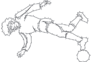
پاسخ مسابقه‌های قبل