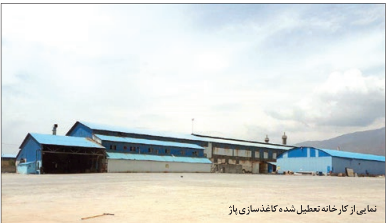
نمایی از کارخانه تعطیل شده کاغذسازی پاژ

کرد: در شهرک صنعتی خیام بیش از ۴۰۰ واحد صنعتی -تولیدی مشغول فعالیت هستند که در ۲۰ واحد از این کارخانجات اعم از تولید روغن، لبنیات، کاغذو شانه تخم مرغ یا در جات مختلف اثرگذاری فرایند تولیدو سیستم های تصفیه پساب همراه با ایجاد بو در فضای شهرک صنعتی خیام ومحیط اطراف است.