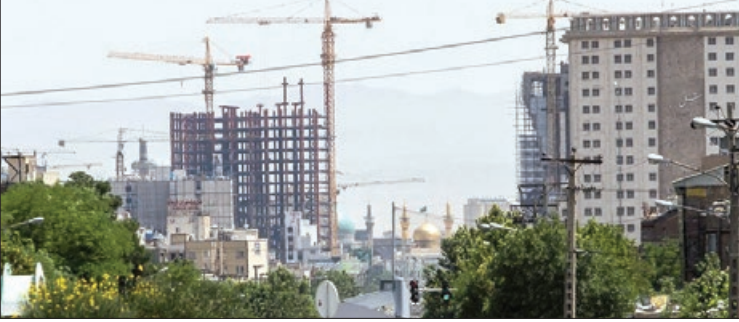
عکس از تهران