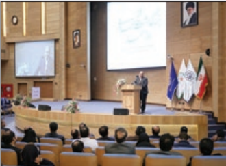
عکس از تهران

شهردار مشهد با تاکید بر این که یکی از موضوعات جدی که با آن روبه ر هستیم، ایجاد حس تعلق مکانی برای مردم است، گفت: در این راستا با حمایت شورای شهر، خریدار محصولات معمارانه برای بهبود سیما و منظر شهری مشهد به منظور ایجاد حس تعلق در شهروندان هستیم. به گزارش پایگاه اطلاع‌رسانی شهرداری مشهد، محمدرضا کلایی روز گذشته در همایش بزرگداشت شیخ بهایی روز معمار که با حضور رئیس و اعضای شورای شهر و تعداد زیادی از فعالان حوزه معماری برگزار شد، اظهار کرد: معتمد در شهر مشهد با وجود کم‌قد مظهر حضرت رضا (ع) مسجد گوهرشاد و... به اندازه‌ای ظرفیت وجود دارد که در مردم حس تعلق ایجاد کند اما اگر منصف باشیم باید بگوییم که این که معماران نامداری چون شیخ بهایی را که بناهای ماندگاری از آن‌ها باقی مانده است، داشته‌ایم در سال‌های اخیر و دوران معاصر اثر ماندگاری که هنر معماری در آن متجلی باشد، ارائه نشده است. کلایی با اشاره به این که سیما و منظر شهری مشهد نیازمند یک معماری مناسب است، اظهار کرد: بر این اساس مدیریت شهری خریدار محصولات معمارانه برای بهبود سیما و منظر شهری است، محصولاتی که به‌عصر معاصر و عناصری که در زندگی کنونی مردم حضور دارند و همچنین با هویت شهر مشهد پیوستگی داشته باشد و باعث ایجاد حس تعلق و ارتباط مردم با سیما و منظر شهری شود.