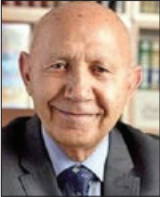
مهر آن مدبری

باب نعمت به واسطه امام رضا(ع) در این سرزمین گشوده شده است مرحوم والدینم، خط عشق به خدا و انس با ائمه هدی(ع) را به من آموختند. مانوس شدن با خدا و ائمه هدی(ع) زندگی را سرشار از آرامشی می کند که هرگز غبار اندوه و ناراحتی بر آن نمی نشیند. من همه ائمه هدی(ع) را دوست دارم، اما امام رضا(ع) را طور دیگری. شاید دلیل آن هم برمی گردد به این که ایشان ولی نعمت ما در ایران اسلامی هستند و خدا به واسطه وجود ذی جود ایشان، باب نعمت را بر ما در این سرزمین گشوده است. به یاد داشته باشیم دوست داشتن و انس با امام رضا(ع) به زندگی مارنگ دیگری می دهد.