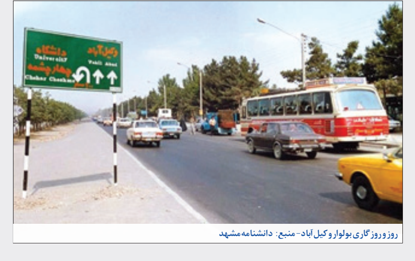
روز وروز گاری بولوار وکیل آباد