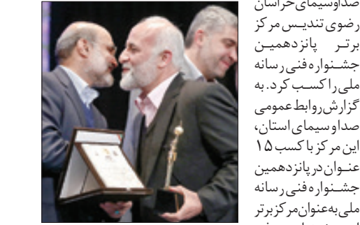
صداوسیما ی خراسان