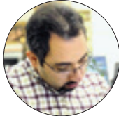
صفحه ۵ | گروه فرهنگ و هنر