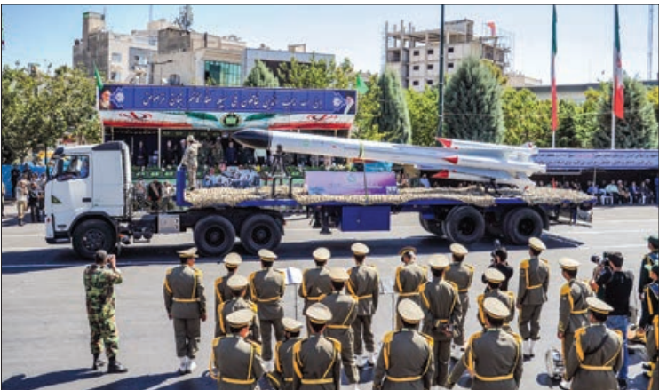
مراسم رژه در مشهد