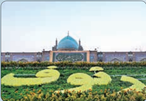
گل‌آرایی حرم مطهر رضوی در دهه کرامت