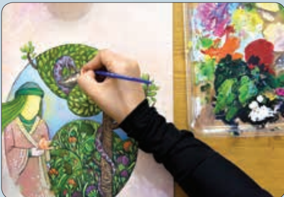
کارگاه تصویرسازی با موضوع «امام الرثوف»