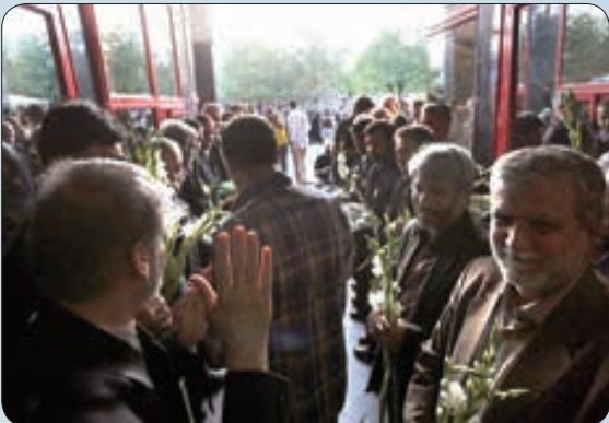
آزادی زندانیان جرایم غیر عمد با حضور خادمان رضوی

هر سحر آفتاب من مولا است به خراسان که جز کویری نیست سینه‌ام دست‌زد عالم خورد از هر آن چه به عمر دل بستم ور شکستم به دور از این درگاه