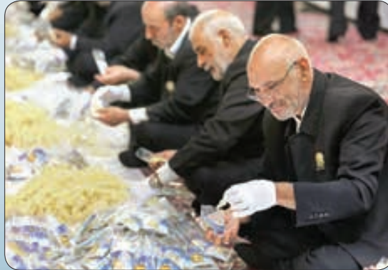
بسته‌بندی نیات متبرک توسط خدام حرم مطهر رضوی