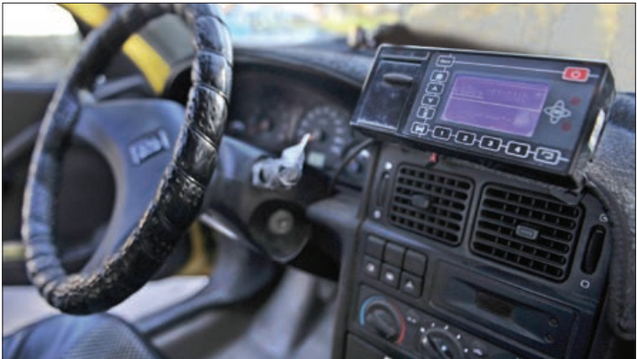
تاکسیمتر دکوری تاکسیران

تاکسیرانی: سختگیرانه و جدی با متخلفان برخورد می کنیم