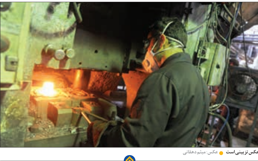
عکس تزیینی است