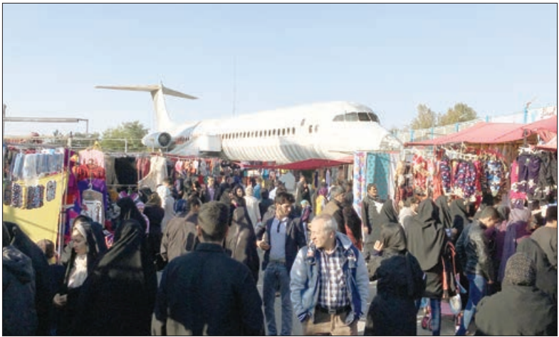
ترافیک در بازار

● به موضوع انسداد معابر رسیدگی می شود سختگوی سازمان میادین میوه تره بار و ساماندی می مشاغل شهری شهر داری مشهد در باره انسداد معابر