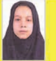
عسل حاجی زاده فرزانتگان ۱