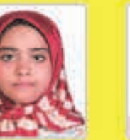
مهسا ایزدی نوقایی