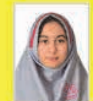
مانیا سود آوری فرزانتگان ۱