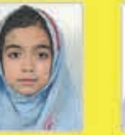
مهسا ایزدی نوقایی