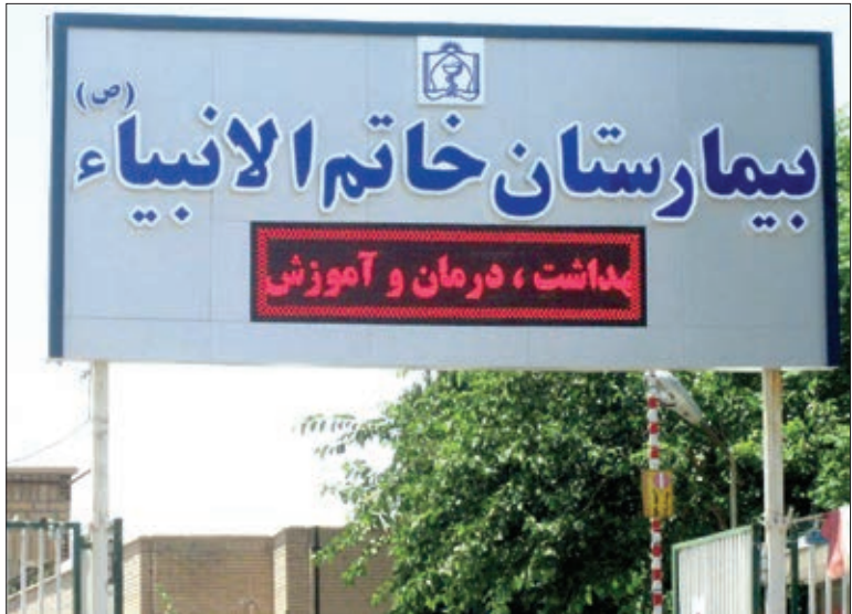
نمایی از تنها بیمارستان عمومی تایباد که پاسخگوی نیاز شهروندان و مسافران نیست