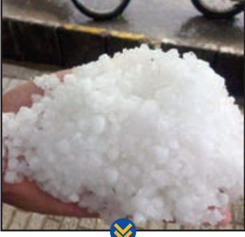
بارش شدید تگرگ در آخرین روزهای فصل بهار در شهر کن تربت حیدریه