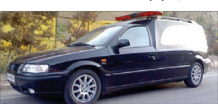
خودروی شهرداری مشهد

بعضی نعلش‌ها با پای خودشان داخل آمبولانس می‌آیند و تعدادی دیگر حتی پا را افتار گذاشته و به خودی خود راهی قبر می‌شوند. اما برخی با جرثقیل هم تکان نمی‌خورند. دنیایی است دنیای میت‌ها... آن‌ها هم مثل ما سرتق تا سر به راه دارند. در ست مثل مازندگان نفس به عاریه، شرو شور دارند و آرام. گفتند جسد امروز را از درون خانه تحویل بگیرید. اولین شواهد عینی و میدانی حکایت از مستاجر بودن آن مرحوم مغفور داشت. گواه این مدعا مرد زیر شلوار ی پوشی بود که در ورودی آپارتمان دو طبقه‌اش را به روی من و جناب مبار که باز کردو به محض دیدن آمبولانس با صدای بلند گفت: «اومدین جنازه مستاجر ما رو ببرین؟ مگه اینکه اون دنیا اصلاح بشه!»