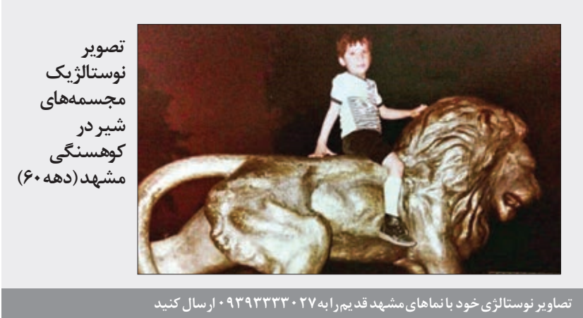
تسانویر نوستالژی خود با نماهای مشهد قدیم را به ۲۷ ۰۹۳۹۲۳۳۳۰۲۷ ار سال کنید