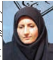
نوازنگر، سرپرست جدید