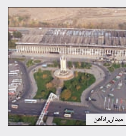
میدان راه آهن