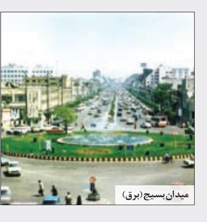
میدان بسیج (برق)