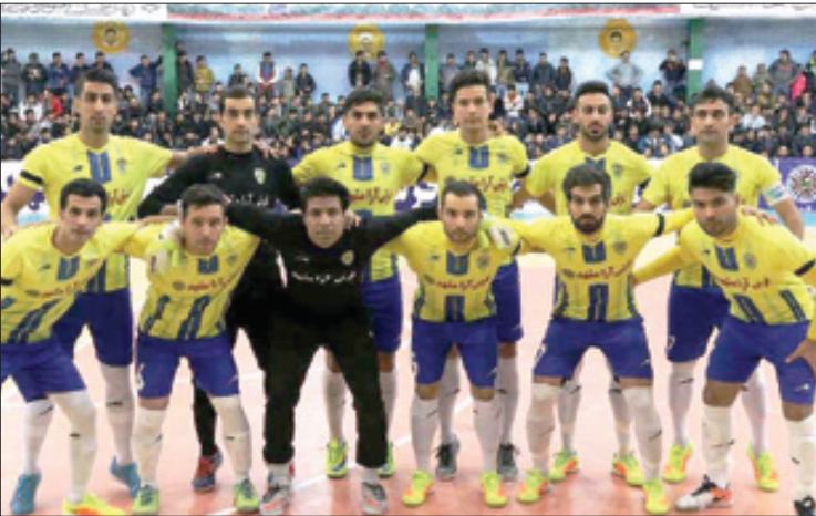
تیم فرش آرای مشهد

وی ابراز امیدواری کرد که با حمایت دست اندر کاران، این فرصت برای تیم های استان فراهم شود تا در این سالن و سالن های مشابه، رقابت های مهم استانی و کشوری خود را با حضور پرشور تماشاگران، برگزار کنند. مرتضایی در پایان با بیان این که این بازی نیز همانند بازی های گذشته در مشهد، بدون لبیت فروشی بر گزار می شود، خاطر نشان کرد: این مسابقه، همچنین به صورت "زنده" از شبکه استانی صدا و سیما ی خراسان رضوی، پخش می شود.