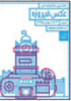
نمایش از خانه تاریخی توکلی