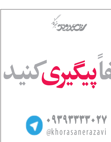
عکس‌ها: مشهد تئاتر

●تخریب ۵ خانه بعد از مستند سازی ایوانی البته به موضوع تلخی هم اشاره می‌کند: بعد از این که مستندسازی این خانه‌ها، صورت گرفت، پنج فقره از این خانه‌ها تخریب شد. ایوانی در پایان صحبت هایش، بار دیگر بر اهمیت حفظ آثار فرهنگی و تاریخی مشهد تأکید می‌کند و می‌گوید: گردشگرانی که به ایران می‌آیند برای تماشای آثار تمان‌ها و برج‌هایی که ساخته شده نمی‌آیند، آن‌ها تشنه دیدن آثار تاریخی هستند اما ما ارزش این آثار را نشناختیم و با تخریب بسیاری از آن‌ها، در عوض برج ساختیم، در حالی که بافت‌های تاریخی در کشور‌های غربی مثل گوهری بار ارزش محافظت می‌شود.