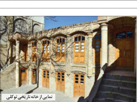
نمایی از خانه تاریخی توکلی

می‌افزاید: خانه‌های تاریخی تخریب می‌شوند و من به عنوان یک فرد دانشگاهی نمی‌توانم جلوی تخریب‌ها را بگیرم اما حداقل کاری که می‌توانم انجام دهم این است که این آثار را مستندسازی کنم تا سندی برای آیندگان باقی‌بگذارد. وی می‌افزاید: این طرح در مراحل ویرایش سوم و چهارم است و بخش‌های مختلف خانه‌های تاریخی مستندسازی شده و مراحل پایانی خود را می‌گذراند. ایوانی این نکته را هم ضمیمه جملاتش می‌کند که «امیدواریم این کتاب سندی برای معرفی خانه‌های تاریخی مشهد باشد، سندی که آیندگان آن را