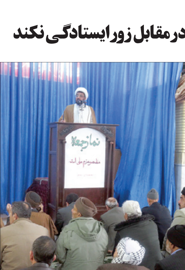
نماز جمعه شهرستان فریمان