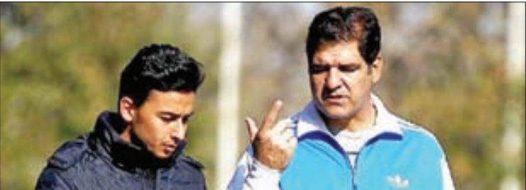
بازیکنان تیم فوتبال سبزوار