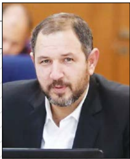
رئیس شورای اسلامی استان تاکید کرد:

اصلاح قانون شوراها برای نقش آفرینی بیشتر مردم در تصمیم گیری‌ها