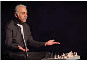
عکس: روابط عمومی نمایش

محتوای اصلی نمایش دیده‌شود، خیلی به‌بازنگر اجاز نمی‌دهم که خود را بر متن تحمیل کند و محتوای قبلی بیفتد؛ شاید این خودخواهی خود من باشد. اما به کار این که داستان ساخته ذهن است و اما یک واقعه تاریخی است که اتفاقی افتاده است؛ ن کرد: شکل نمایش یک تئاتر شبیه مستند است چرا که آدم‌ها ذهنی اند اما در تئاتر مستند ما کاراکترهایی داریم که واقعه هستند. رستگار و دانش به اتفاق که در ابتدا این نمایش می‌شود افتد و از آن یکی از کاراکترهای نمایش نشستی را به مخاطبان محول می‌کند، اظهار کرد: نمایش یک واقعه تاریخی است و تماشاگر نباید به عنوان تنباهیک بیننده برای تفریح و تفتن به سالن بیاید؛ و مقابل هر واقعه انسان مسئول است، نمی‌شود بیایی و رها کردن؛ ایمنی و سقوط در خصوص بازی و نمایش نظر بدهی، تو در جایگاهی نشسته ای که باید فضات بکنی، من بخش هایی از نمایش و ما بعد این گونه طراحی کردم که شخصیت‌ها در مقابل مخاطبان را بگیرند و در دوری آن‌ها با آن‌ها حرف بزنند. ی گفت: من در این نمایش از چند شکل روایت استفاده کردم، یکی از آن‌ها اسطوره بود، دیگری داستان، همچنین قصه، خاطر و گزارش را در شکل‌های به این روایت استفاده کردم. تئاتر ۲۱: که نوشته امیر سستگار مطلق و منصور جهانبخش است، داستان بخشی از پلاهایی را که رژیم بعث بر سر کرده‌هاورد ساخت، و قالب درامی اجتماعی-تاریخی روایت می‌کند. این نمایش هر روز ساعت ۲۰ روزی هفتی و شنبه و پنجشنبه در خیابان هاشمیه ۲۰ روزه صحنه می‌رود.