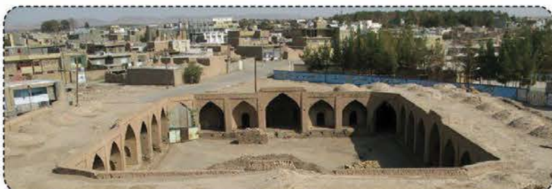
رابط فیض آباد