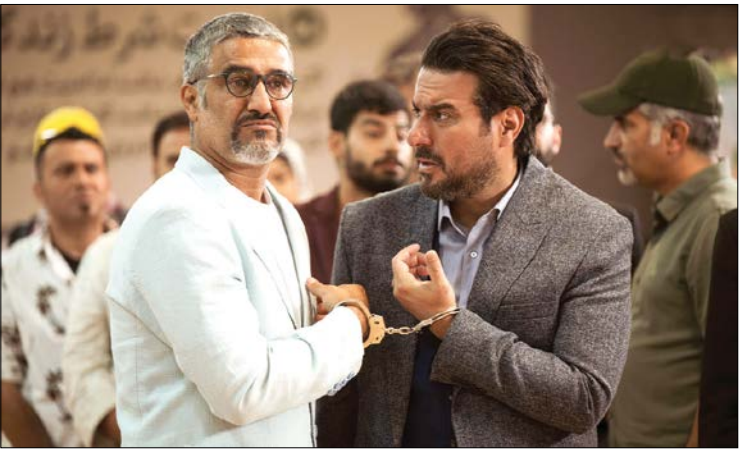
نمایی از فیلم هتل، پر فروش ترین فیلم سینماهای استان

است. طی تابستان امسال سینماهای استان در مجموع ۲۰ میلیارد و ۸۶۳ میلیون و ۳۵۴ هزار تومان فروش داشته اند. از نظر میزان مخاطبان هم در پاییز امسال تعداد تماشاگران پرده نقره ای بیش از دو برابر نسبت به تابستان افزایش داشته است.