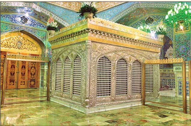
ضریح سیمین وزرین