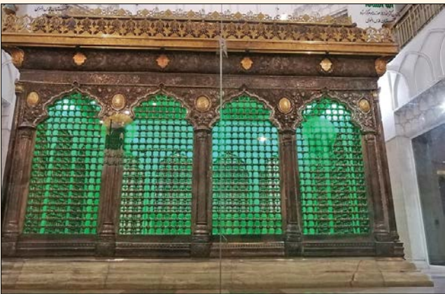
ضریح شیر و شکر