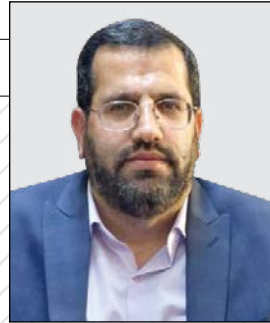
یک مسئول در شهرداری مشهد هشدار داد:

زنگ خطر افزایش قارچ گونه کارخانه های ایزوگام