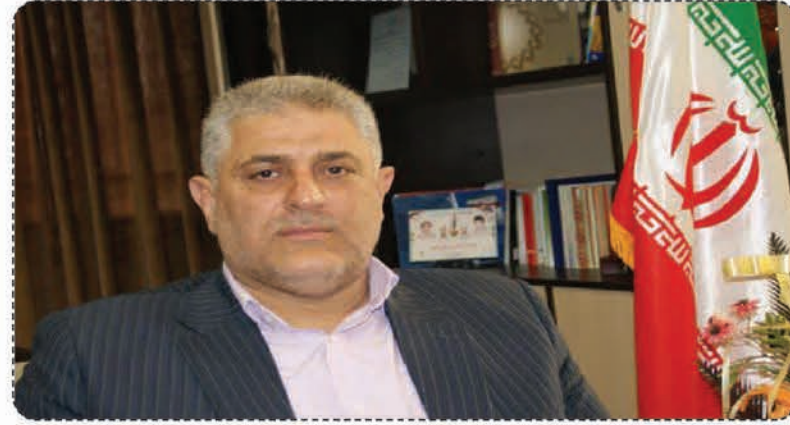
حسین جمشیدی فرماندار شهرستان تربت جام

در این مجموعه مشتری اولین و مهمترین اولویت ماست و فعالیت ها به گونه ای طراحی و برنامه ریزی شده اند که بتوانیم نیازها و سفارشات مشتریان را در سریع ترین زمان، با کمترین هزینه و با بهترین کیفیت تامین و ارسال نماییم. تلاش نموده ایم که با اولین حضور