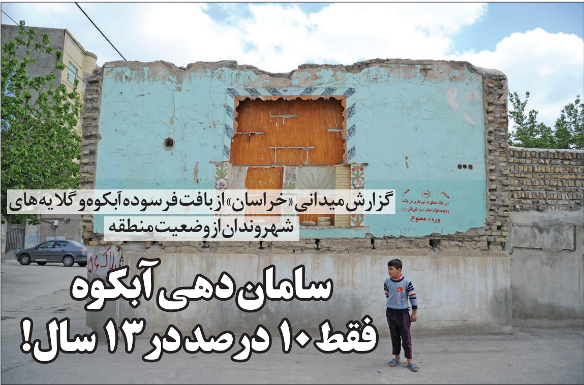
گزارش میدانی «خراسان» از یافت فرسوده آبکوه و گلابه های شهروندان از وضعیت منطقه

● شهرداری بحث خرید در منطقه آبکوه را ندارد به مدیر طرح نوسازی منطقه آبکوه می گوئیم بر اساس گزارش میدانی ما، مردم منطقه اذعان می کردند که اطلاعی از تسهیلات تشویقی ندارند یا از توانایی مالی برای سکونت در جای دیگر در صورت فروش زمین با قیمتی که شهرداری می خواهد بخرد، برخوردار نیستند. وی در پاسخ اظهار می کند: البته الان شهرداری بحث خرید را ندارد، یک سطح سرانه برای قطعات مسکونی در نظر گرفته شده است و صاحبان منازل مسکونی با مشارکت همسایگان برای بازسازی اقدام می کنند، واقعیت این است که شهرداری نمی تواند یک دفعه شق القمر کندو به افراد منطقه بگوید که به ازای زمین شما، زمین دیگری می دهد. بضاعت مالی شهرداری هم مشخص است و در حدی نیست که بتواند این اقدامات را انجام دهد. وی با بیان این که اگر دو خیابان اصلی در منطقه آبکوه بازگشایی شود، رونق زیادی در این منطقه ایجاد خواهد شد، می افزاید: خود مردم می توانند با مشارکت همسایگان یا سرمایه گذاران برای نوسازی اقدام کنند، اما برخی از افراد توانایی این کار را ندارند و این فراتر از اختیارات شهرداری است، اگر راه و شهرسازی بتواند درباره تخصیص بودجه ملی برای این منطقه اقدام کند می توان دیگر مشکلات مثل همین مواردی را که ذکر کردید، رفع کرد. وی تاکید می کند: در تمامی ادوار دولت ها و سازمان های زیادی در سامان دهی یافت اطراف حرم مطهر در گیر بودند اما تاکنون به سرانجام نرسیده است، شهرداری به تنهایی