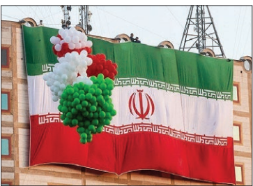
رئیس شورای هماهنگی تبلیغات اسلامی خراسان رضوی گفت: در دهه فجر امسال هزار و ۲۶۱ پروژه عمرانی در استان بااعتبار ۱۹۴ میلیارد

بهره برداری از ۱۲۶۱ پروژه در دهه فجر امسال