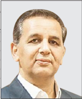
عضو هیئت مدیره شرکت باز آفرینی شهری ایران خبر داد:

چهارشنبه ۷ دی ۱۴۰۱ / ۴ جمادی الثانی ۱۴۴۴ ۴ صفحه / شماره ۵۱۴۷ / قیمت: ۶۰۰ تومان Wed . 28 . Dec . 2022 . No.5147