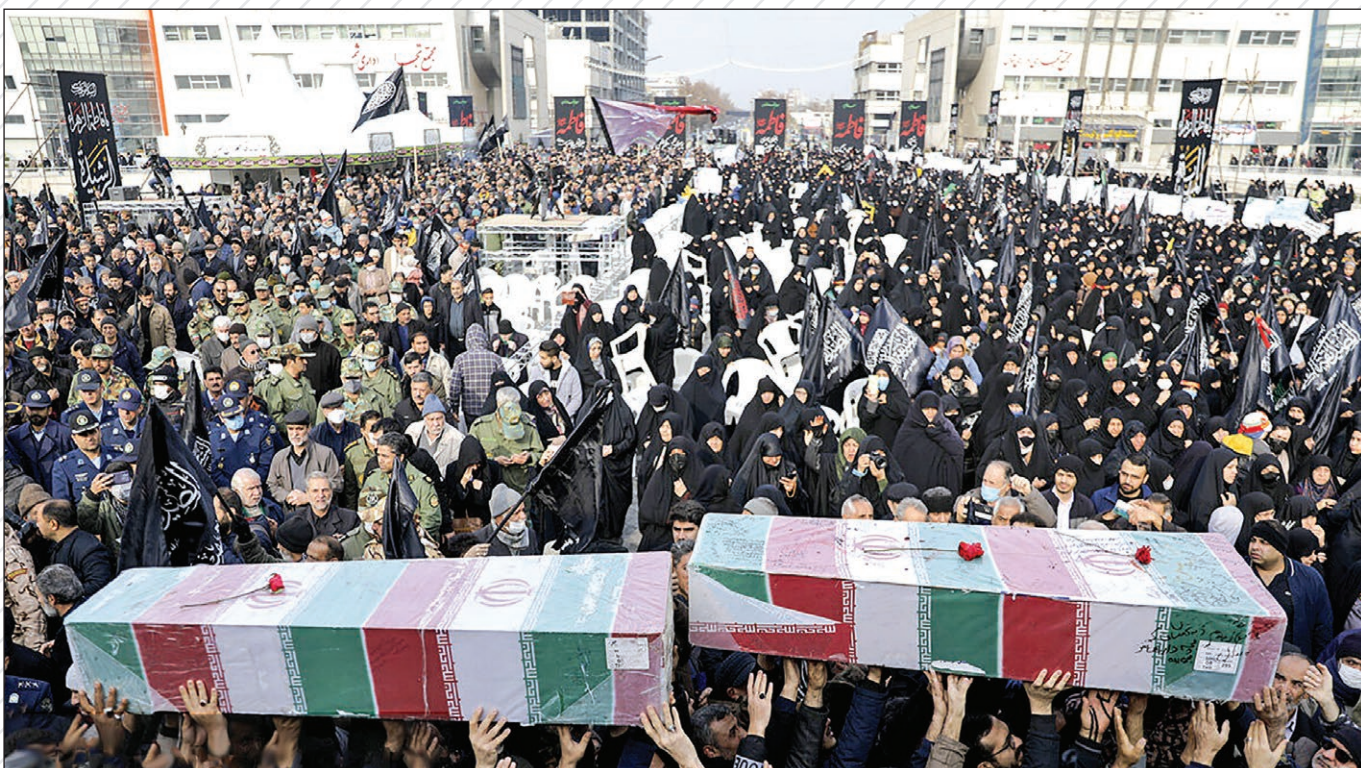
همزمان با اجتماع عظیم عزاداران فاطمی پیکر ۱۰ شهید در مشهد تشییع شد