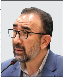
استاندار خراسان رضوی مطرح کرد ثبت ۱۰۰ درصدی اشتغال در ۱۷ شهرستان