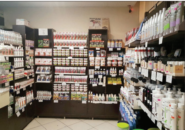
مجوز داروخانه های دام پزشکی

مدیر کل دام پزشکی استان درباره گلایه های فعالان دام پزشکی مشهد از وضعیت صدور پروانه داروخانه های دام پزشکی به «خراسان رضوی» می گوید: هم اکنون بین نظام دام پزشکی و سازمان دام پزشکی اختلاف نظری وجود دارد مبنی بر این که عده ای معتقدند تعداد داروخانه های دام پزشکی باید متناسب با شرایط موجود صادر شود، این موضوع مسئله ای صنفی و بازاری است و نظریه ای خودخواهانه است، سازمان دام پزشکی اعتقادش بر این است که هر کس تمایلی دارد که کسب و کاری راه بیندازد بر اساس همان قانون می تواند مجوز