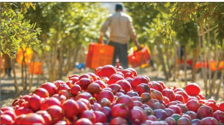
انار کاران در شهرستان خراسان رضوی

گلايه انار کاران از افت شدید قیمت و بی رغبتی به برداشت محصول