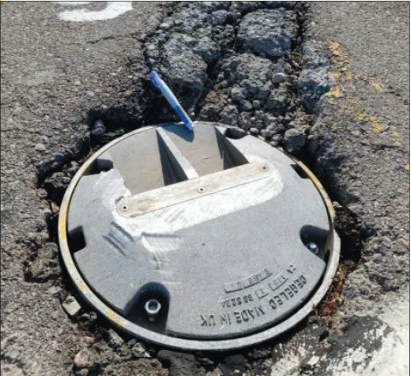
خرابی در محل لایتنینگ و ایجاد FOD آن و ایجاد محل