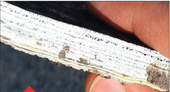
لایه های مختلف رنگ جدا شده از سطوح که به دلیل پاک نشدن لایه های قبلی رنگ، پیش از رنگ آمیزی جدید در باند اتفاق افتاده