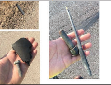
وجود قطعات فلزی و پلاستیکی در حاشیه باند