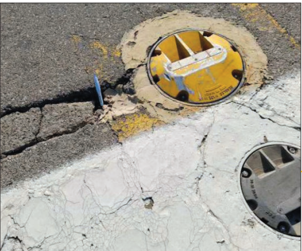
ترمیم خرابی در محل لایتنینگ و ترمیم نشدن خرابی در قسمت هایی که به دلیل عبور سیم ها دچار خرابی شده است

وی همچنین ۱۱ مردادماه پس از یک حادثه دیگر برای هواپیمای سپهران گفته بود: به طور کلی کیفیت باند فرودگاه مشهد بسیار بالاست و نکته ای که در باره رنگ آمیزی اتفاق افتاده مربوط به همه جای باند نیست و فقط برخی از نقاط مشکلاتی داشته که هیچ یک از پروازهایی که تاکنون دچار ترکیدگی لاستیک شده اصلاً در محلی که رنگ آمیزی آن ها شاید مشکل دارد اتفاق نیفتاده است. به هر حال، ذکر این نکته ضروری است که با وجود درخواست های مکرر روزنامه خراسان برای بازدید از باند فرودگاه، مدیران فرودگاه شهید هاشمی نژاد مجوز لازم را برای حضور خبرنگار خراسان صادر نکرده اند.