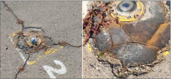
خرابی روستایی در محل چراغ ها (چپ)