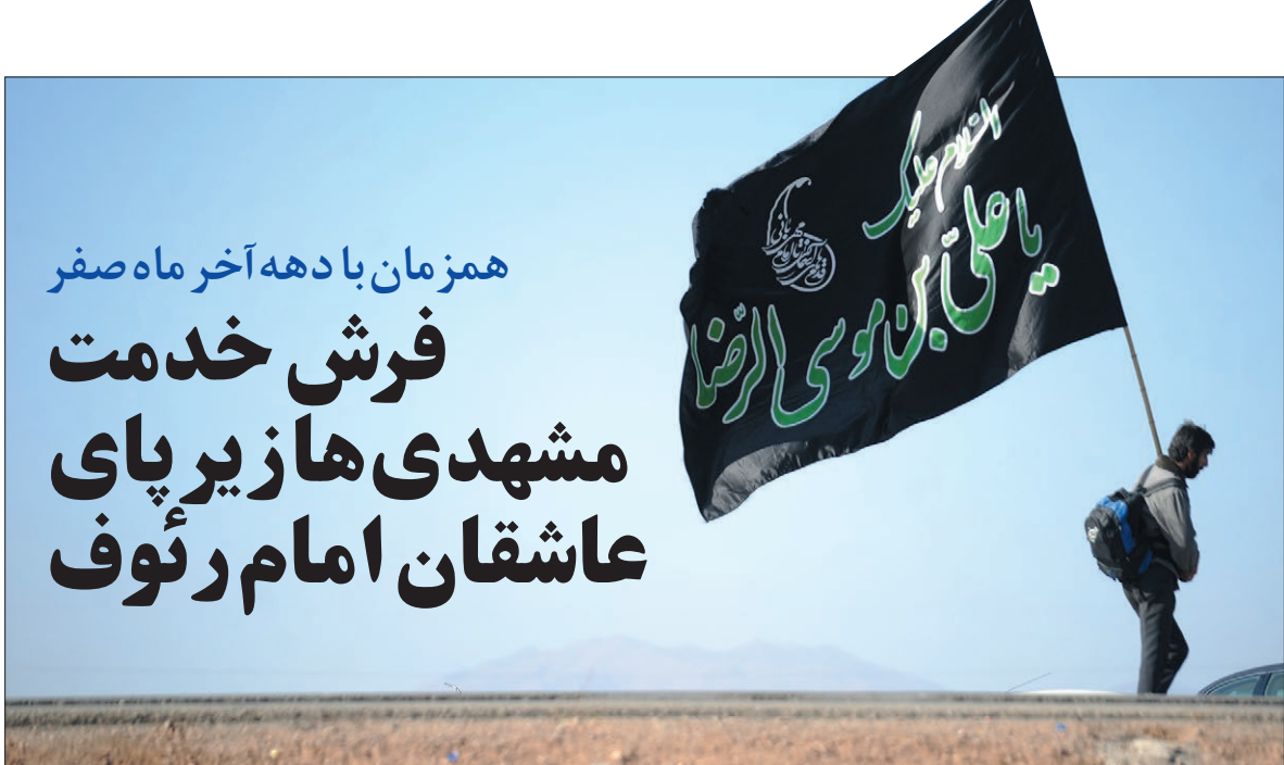
علی بن ابی طالب

اسکان و حمل‌ونقل درون‌شهری مانند تاکسی‌ها و همچنین استفاده از اپلیکیشن‌های مختلف برای دسترسی راحت مسافران به مکان‌های اسکان اشاره کرد.