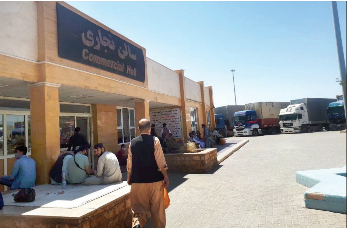
عکس: خراسان - ۱۴۰۰/۰۳/۱۳

روزنامه سیاسی، اقتصادی، فرهنگی، اجتماعی خراسان رضوی