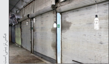
عکس از بستن است