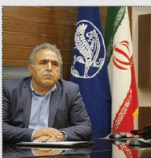
رضایابی رئیس هیئت مدیره