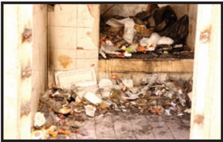
قبل از نظافت و پاک‌سازی