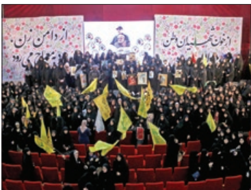
دختران شهدای جهان اسلام با حضور در همایش «دختران حاج قاسم» با آن سر دار دل ها پیمان بستند