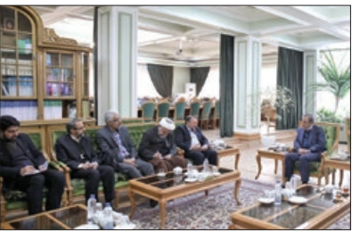
استاندار در دیدار اعضای هیئت نظارت بر انتخابات استان: