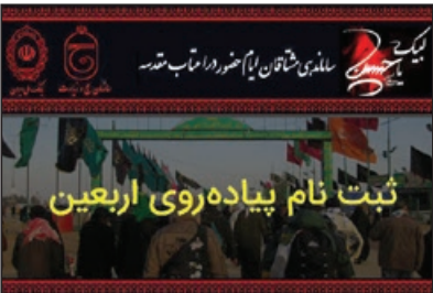
تاصبح دیروز صورت گرفت