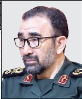
سردار نظری خیبر داد:

۲۳ هزار بسته لوازم تحریر در مناطق محروم خراسان رضوی توزیع می شود